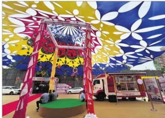
The Textiles Ministry launches 'Haat on Wheels'.

The celebration was inaugurated by Union Minister of Textiles Giriraj Singh and Minister of State Pabitra Margherita. This year's theme, "My Handloom, My Pride; My Product, My Pride", highlights the value of indigenous craftsmanship and