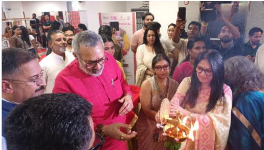
Union Minister of Textiles Giriraj Singh inaugurated the Exclusive Handloom Expo and the “Haat on Wheels” at Handloom Haat, in New Delhi.